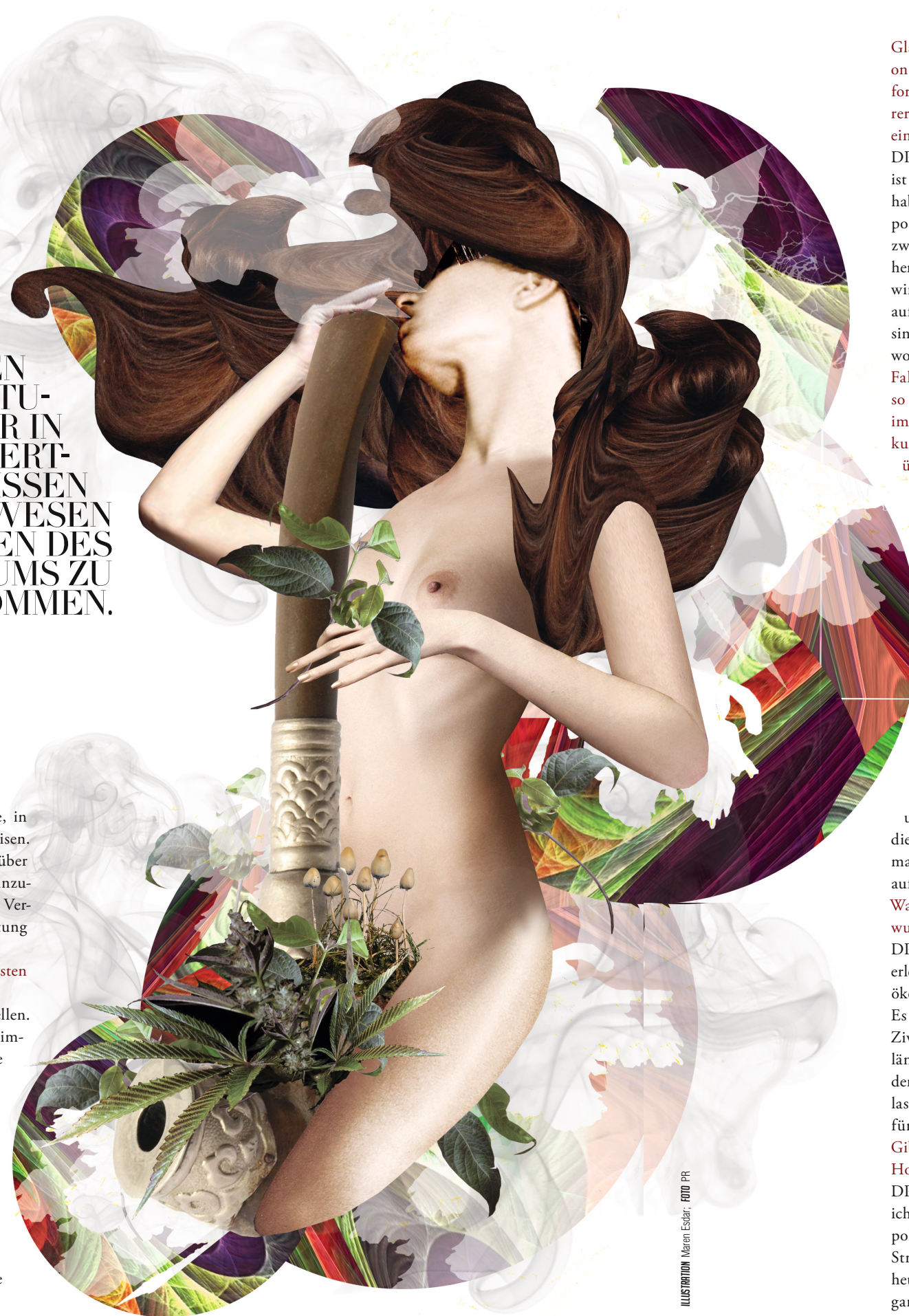
ILLUSTRATION: Maren Esterl; FOTO: PR

konnte den Seelen der Toten begegnen. Ich war in der Lage, in einer Art astralen Flugobjekt zu Schlössern und Palästen zu reisen. Ich konnte multidimensionale Geometrien wahrnehmen. Darüber hinaus wurde mir die große Möglichkeit zuteil, in mich hineinzublicken und Heilung zu initiieren. Ich konnte plötzlich meine Verhaltensmuster durchschauen und bekam gleichzeitig die Anleitung mitgeliefert, sie zum Besseren hin zu ändern.